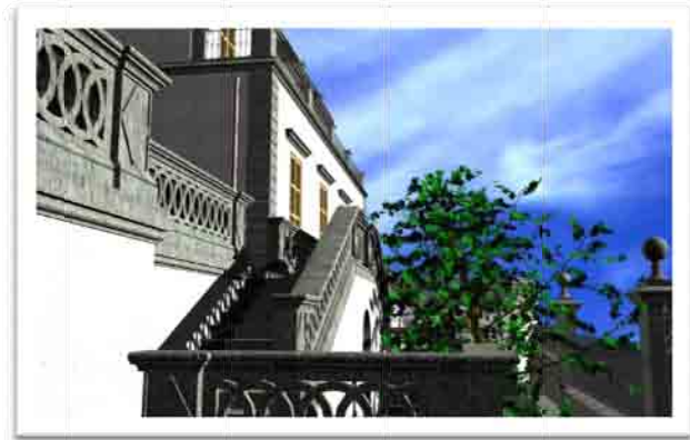
Render dello stato attuale con in evidenza il peperino utilizzato per le finiture.

Dalla morte di Giuseppe Barattolo, invece, la Villa non vivrà più il periodo d'oro di quei primi anni che la rendevano, seppur per pochi mesi l'anno, uno dei salotti cultural-mondani della borghesia romana; con i successori, Vittorio e poi Filippo, è sempre meno abitata e lasciata alla sola opera dei guardiani che si avvicendano. Di questi anni è la chiusura della finestra lato nord-est al secondo piano,