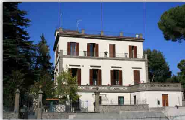
Villa Barattolo subito dopo la ristrutturazione.

Villa Barattolo , attuale sede dell'Ente Parco Regionale dei Castelli Romani , si colloca a buon diritto tra le realizzazioni architettoniche di un certo prestigio che, negli anni a ridosso del 1900, contribuirono a costituire quella che è stata codificata come la terza fase dell'espansione urbana del centro abitato di Rocca di Papa. L'edificio fu realizzato nella zona di crinale a nord-ovest dell'area urbana. Non deve ingannare l'attuale nuova veste della zona dei giardini e del parcheggio che fa apparire la Villa decentrata rispetto alla vita del paese, posizionata com'è nel prolungamento periferico rispetto alla piazza, quando fu realizzata questa era in posizione principale rispetto alla "porta d'accesso" al paese.