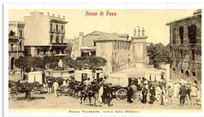
Piazza Regina Margherita (1905) con ancora il convento della Mercede.

Infatti l'attuale area che va dai giardini, con il monumento ai caduti, al nuovo parcheggio e parte dell'area di proprietà dell' Ente Parco , che affaccia su via Cesare Battisti , era occupata fin dalla seconda metà del Cinquecento da un antico convento, prima dei padri Mercedari, poi di quelli Trinitari. Accanto al convento si trovava la chiesa di san Pietro Nolasco e la prima area cimiteriale del paese. Tutto il complesso aveva accesso direttamente da quella che poi divenne la piazza Regina Margherita . Nell'ambito dell'assetto urbano, nel 1905-06 chiesa, convento e cimitero furono smantellati per lasciar posto ai giardini comunali cui tutto intorno, a ferro di cavallo, girava