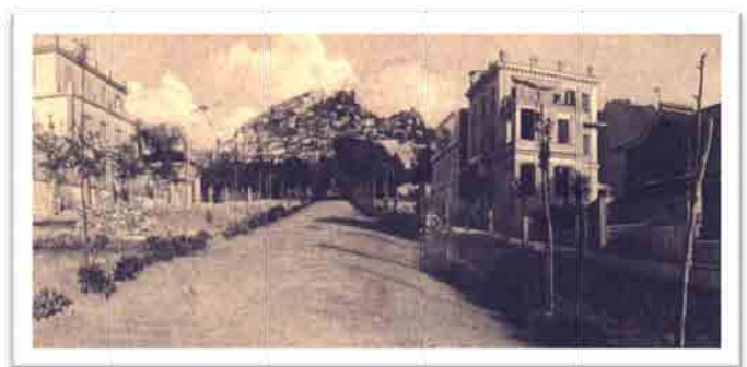
Viale della Funicolare (1908) con a sinistra Villa Barattolo.

La costruzione, concepita quale residenza estiva, risulterà la più grande fra le cinque autorizzate, con i suoi quasi 1000 mq coperti, i 7500 mq di parco e, anche, con una piccola cappella posta sulla antica strada per Marino, delimitante il fondo dei Barattolo verso valle (classificata all'epoca come "Oratorio privato non aperto al pubblico" e sottoposta nel 2009 ad intervento di restauro da parte dell'Ente Parco Regionale dei Castelli Romani ). L'edificio si articola su tre livelli per un totale di 17 vani ed ha copertura piana praticabile caratterizzata da un'ampia e scenografica vista panoramica praticamente a 360°, poiché offrirebbe – oltre al "consueto" affaccio sulla vallata, proprio dell'intero paese – anche la vista opposta verso il centro storico, come dimostrato dalle molte cartoline d'epoca da qui scattate.