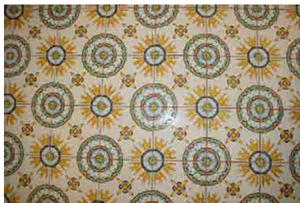
Una delle pavimentazioni in ceramica al piano primo ancora visibile.

Per esigenze funzionali/distributive l'antico accesso principale della Villa è inutilizzato, sostituito nella funzione da quello posto al piano strada, che inizialmente era ingresso secondario alla zona della servitù. Occultati, in gran parte, i pavimenti originari tra cui quelli in ceramica smaltata (decorata per lo più con vivaci colori a motivi floreali), di probabile manifattura campana, che abbellivano, ancora nel 2003, gli ambienti della Villa . Anche il prospetto est subisce una radicale trasformazione legata allo svuotamento del terrapieno e alla conseguente realizzazione di un nuovo ambiente con quattro nuove finestre. Sempre all'esterno, si può osservare che le balaustre, i pilastri del varco di accesso e le opere di arredo e contenimento, in gran parte in Peperino di Marino non sono stati interessati da interventi di restauro e oggi risultano in avanzato stato di degrado.