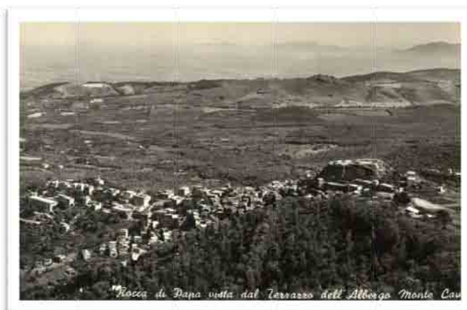
Veduta degli anni '50 con la zona dei villini, in evidenza sulla sinistra, ortogonale al nucleo del centro storico.

Di epoca recente è invece il tracciamento della parte di pertinenza dell'attuale Corso della Costituente , evidente nella sua eterogeneità e preludio allo sviluppo ottocentesco sulle aree della spianata sottostante.